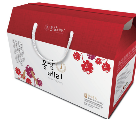
紅参ベリー (覆盆子・紅参 飲料)

「紅参ベリー」飲料は、高敞の歴史と伝統をそのまま受け継いだ覆盆子の新鮮な味を味わえる、心を込めて作られた製品です。美と長寿を象徴する覆盆子と紅参が溶け合っているまろやかな味と香りの紅参ベリーで、幸せなひとときを味わってください。覆盆子と紅参の効能を堪能できます。