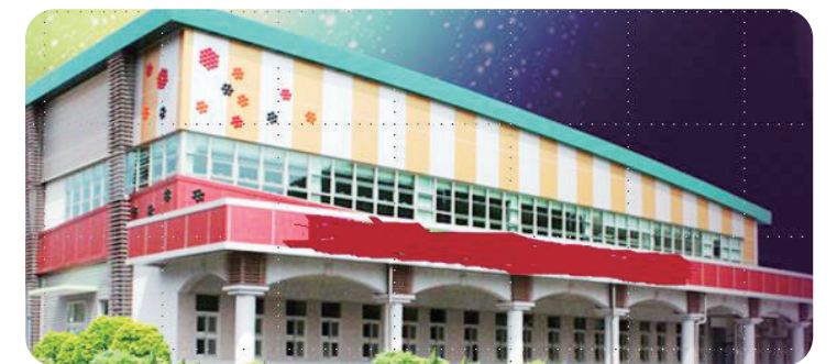
高敞郡(財)BERRY&BIOしょくひんヨングソ