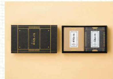
맛의명태자 시그니처 명란 혼합세트 D호 54,000