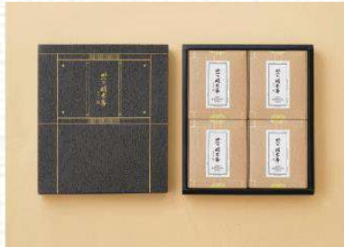
맛의 명태자 시그니처 명란 세트 4호 121,000