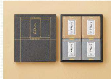
맛의명태자 시그니처 명란 세트 3호 129,000

구성: 명란200g*2ea+순명란200g*2ea 사이즈: 280x320x45mm