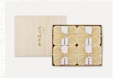
맛의명태자 더밸류 명란 혼합 세트 3호 90,000

구성: 명란200g*2ea+참난200g+오징어200g 사이즈: 305x240x50mm