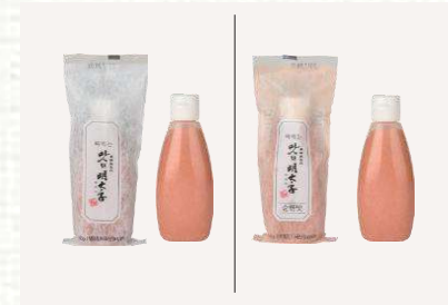
짜먹는 맛의 명태자 140 (오리지널/순한맛) 9,900/10,900