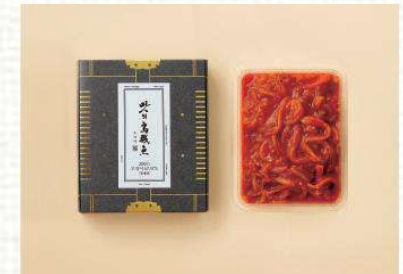
맛의 오적어 / 오징어 19,000