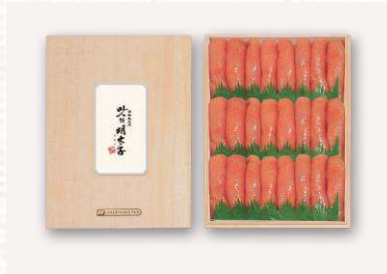
맛의명태자 프리미엄 명란 3000 375,000