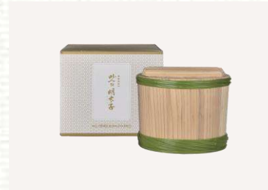
맛의명태자 프리미엄 명란 1000 147,000

구성: 프리미엄 명란1500g(750g*2ea) 사이즈: 240×300×70mm