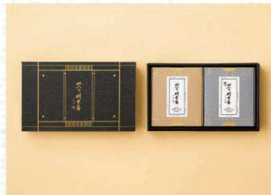
맛의명태자 시그니처 명란 세트 2호 66,000