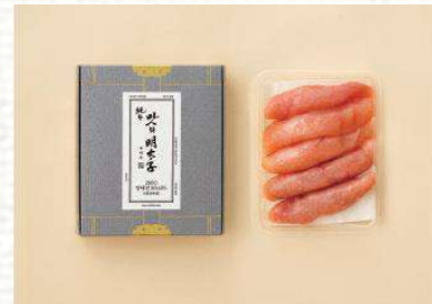
순한 맛의 명태자 / 온명란 31,000