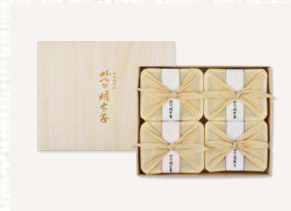
맛의명태자 더밸류 명란 혼합세트 2호 95,000

구성: 명란200g*2ea+참난200g+오징어200g 사이즈: 305x240x50mm