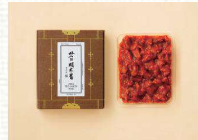
맛의 명태위 / 창난 14,000