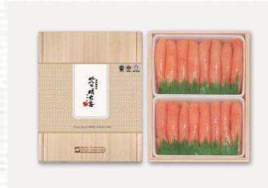
맛의명태자 프리미엄 명란 1500 225,000

구성: 프리미엄 명란1500g(750g*2ea) 사이즈: 240×300×70mm