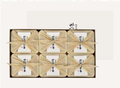
맛의명태자 프리미엄 명란 세트 217,000