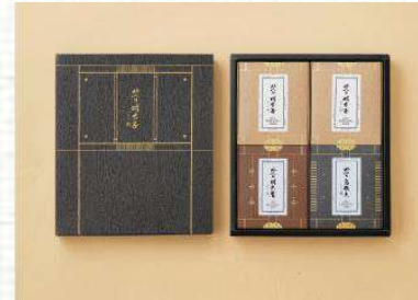
맛의명태자 시그니처 명란 혼합세트 A호 100,000

구성: 명란200g*2ea+순명란200g*2ea 사이즈: 280x320x45mm