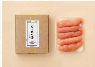
맛의 명태자 / 온명란 27,000