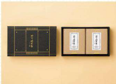
맛의명태자 시그니처 명란 세트 1호 62,000

구성: 명란200g+순명란200g+참난200g+오징어200g 사이즈: 280x320x45mm