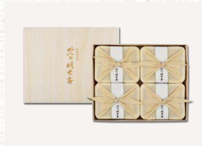
맛의명태자 더밸류 명란 세트 1호 116,000