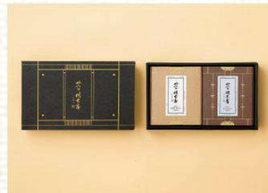
맛의명태자 시그니처 명란 혼합세트 C호 49,000